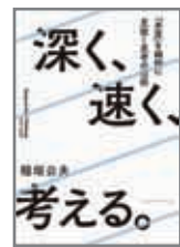
深く、速く、考える。 クロスメディア・ナブリッシング (2016/05/27)

【著書】「TOC革命」「TOCクリティカルチェーン革命」「アメリカ生産革命」「EMS戦略」(2001年日経BP/Biztech図書賞受賞)「メイドインジャパンの復活」【翻訳書】「リーンシンキング」「ザ・トヨタウェイ」「ザ・トヨタウェイ実践編」「トヨタ製品開発システム」「トヨタ経営大全1..人材育成」「トヨタ経営大全2.企業文化」「トヨタ危機の教訓」「深く、速く、考える。ものごとの本質を瞬時に見抜く思考の技術」