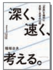
深く、速く、考える。 クロスメディア・ナブリッシング (2016/05/27)

【著書】「TOC革命」「TOCクリティカルチェーン革命」「アメリカ生産革命」「EMS戦略」(2001年日経BP/Biztech図書賞受賞)「メイドインジャパンの復活」【翻訳書】「リーンシンキング」「ザ・トヨタウェイ」「ザ・トヨタウェイ実践編」「トヨタ製品開発システム」「トヨタ経営大全1..人材育成」「トヨタ経営大全2.企業文化」「トヨタ危機の教訓」「深く、速く、考える。ものごとの本質を瞬時に見抜く思考の技術」